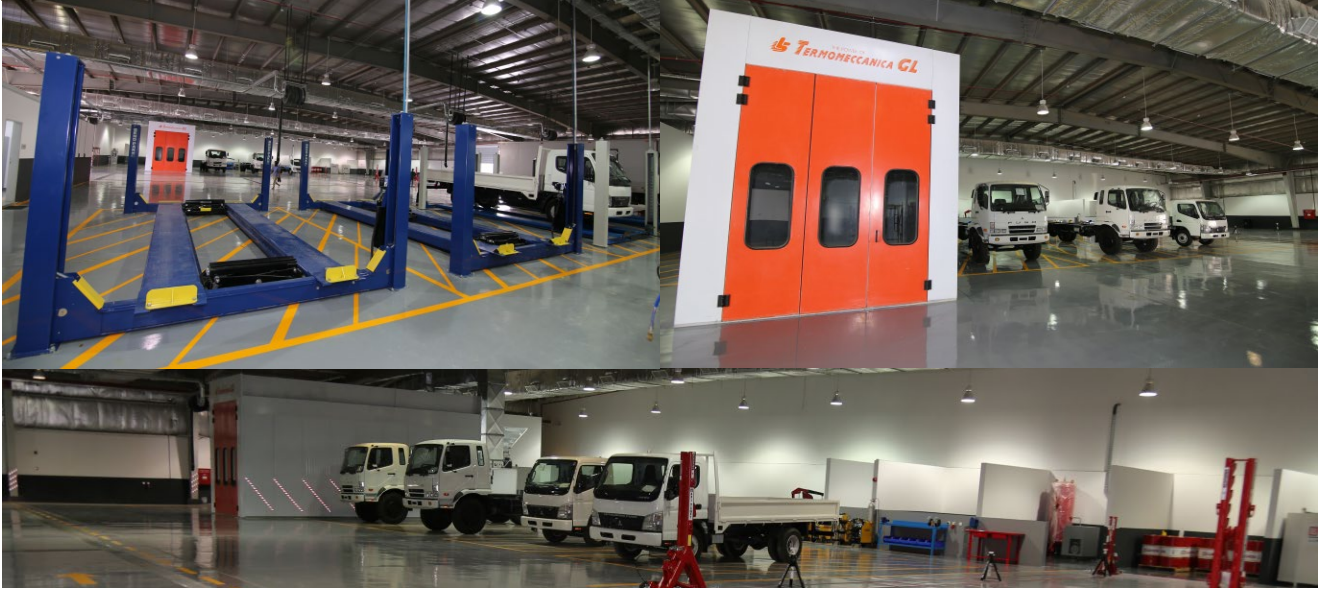
قسم السيارات في المجموعة يتوسّع نحو عملاء جدد في السعودية