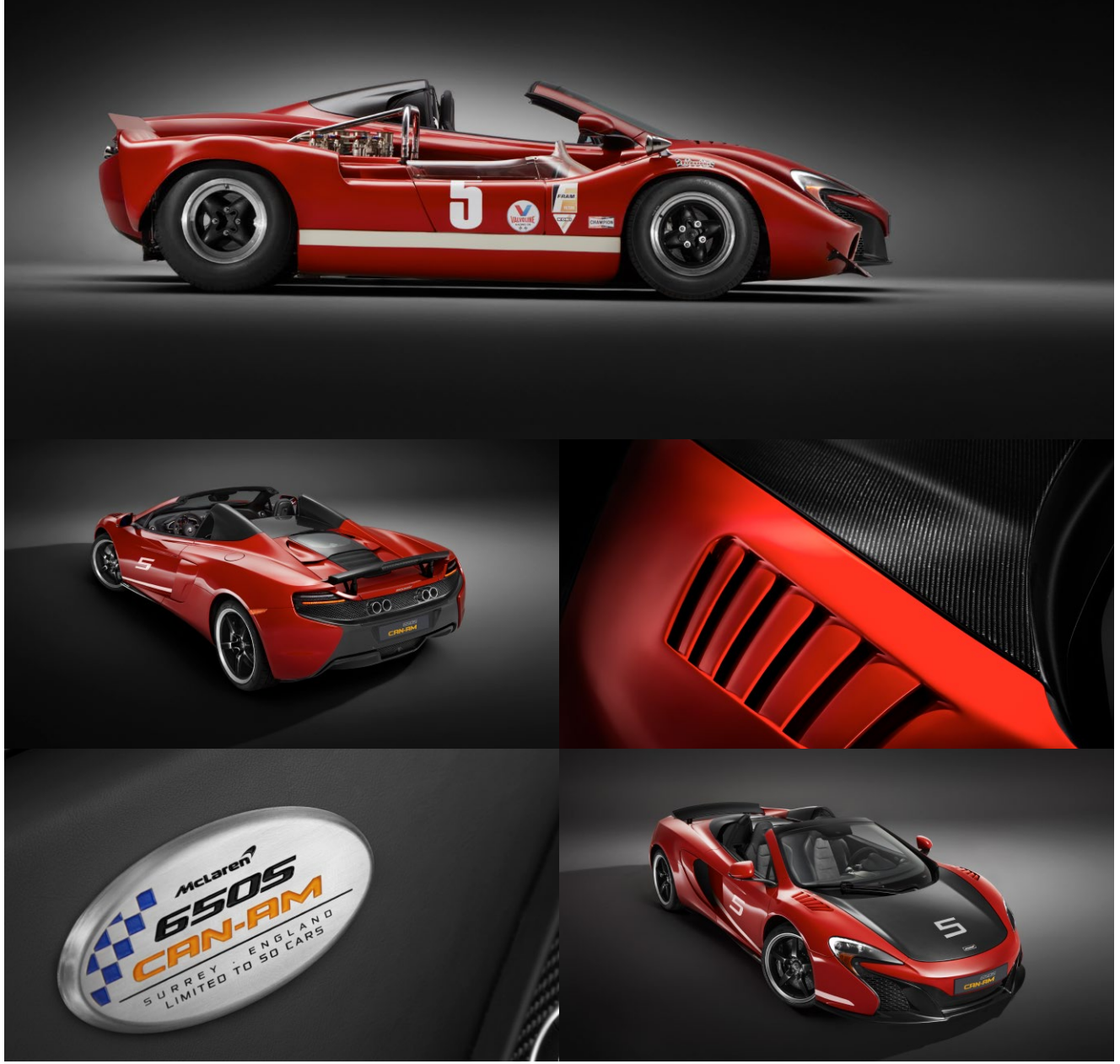
سيارة McLaren 650S Can-Am من مكلارين التي جرى إطلاقها في الإمارات في أغسطس 2016 ضمن إصدار محدود من 50 سيارة