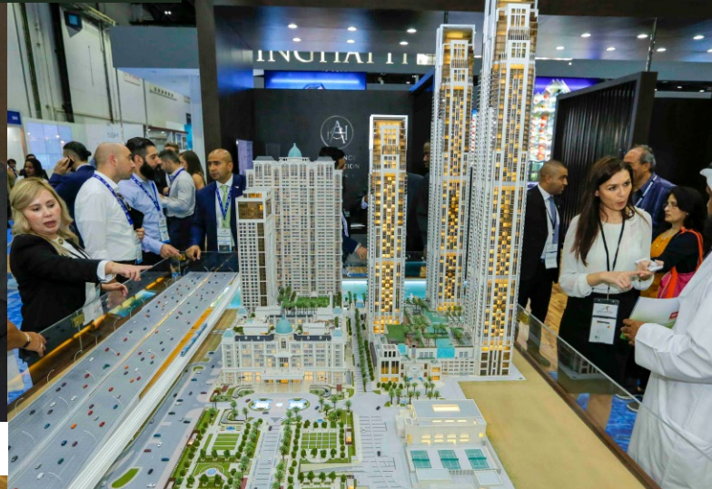
الآلاف من الزوار زاروا جناح مجموعة الحيّطور من 6-8 سبتمبر 2016