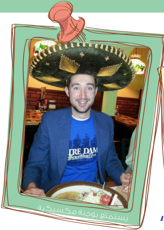
يستمتع بوجبة مكسيكية