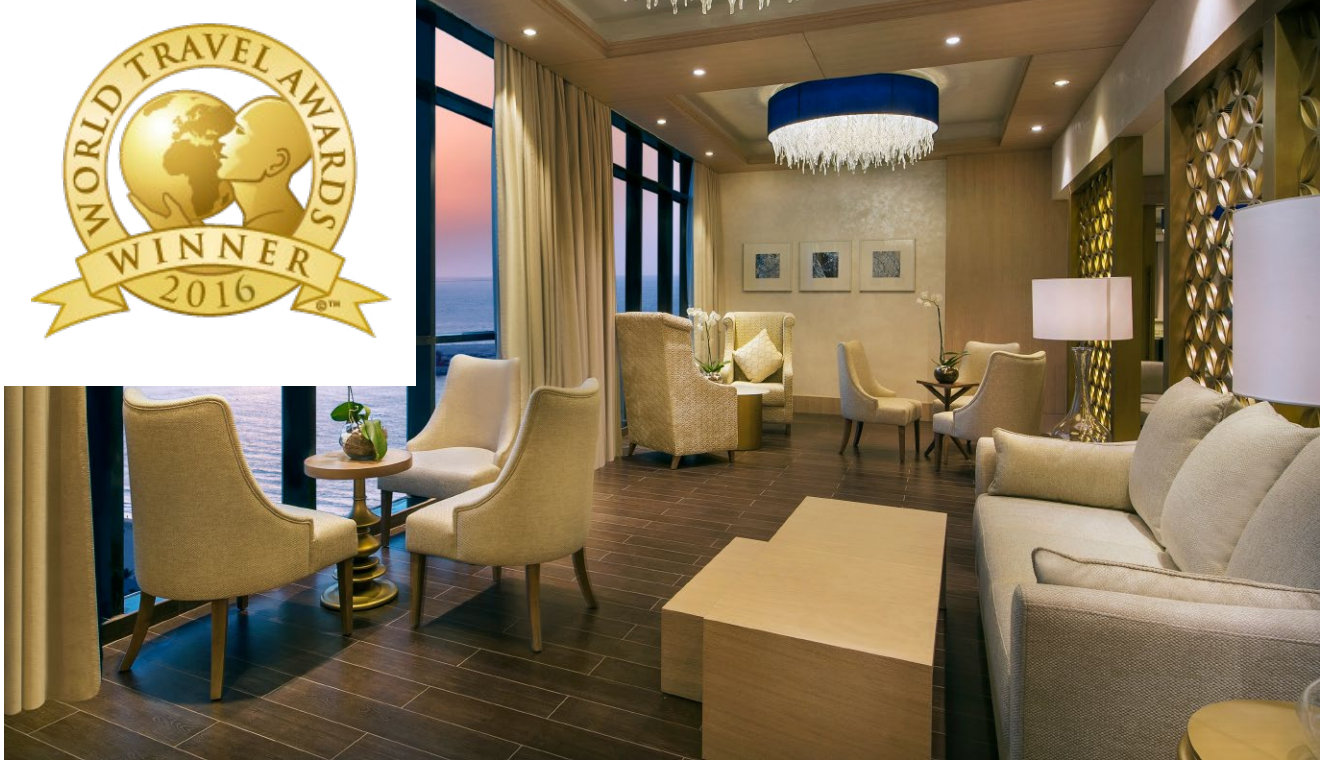
قفو الكلوب لاونف فف الطابق 25 وطفل على مناظر ؤلابة لشاطىء دبي ونؤلة ؤمفرا