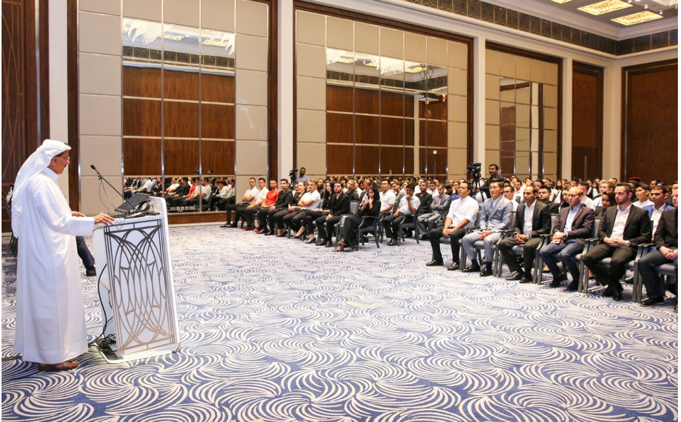
الموظفون مجتمعون في قاعة الجود، ويستن دبي، الحبتور سيتي