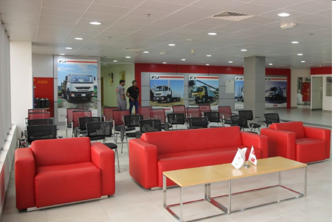
نُظمت فعاليات "فوسو فابريكايترز" تحت عنوان "بناء الجسور"