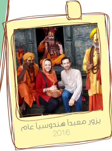
يزور معبداً هندوسياً عام 2016